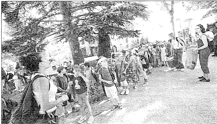
Après avoir réuni plus de 1500 enfants en 2007 au parc du Château de Mouans-Sartoux, c'est à La Palestre que se tient le Festival des droits de l'enfant.

1500 enfants l'an passé Il y aura de l'ambiance à La Palestre. 1500 enfants s'étaient rendus à la première édition du Festival à Mouans-Sartoux l'an dernier. La présidente de l'association d'action éduca-