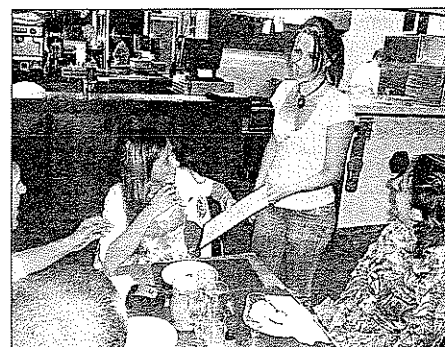
Bien placé dans le quartier et doté d'un vaste potentiel de clients, le restaurant/brasserie La Terrasse offre une cuisine familiale.

« Nous proposons 24 plats du jour chaque mois, pour un maximum de 26 couverts